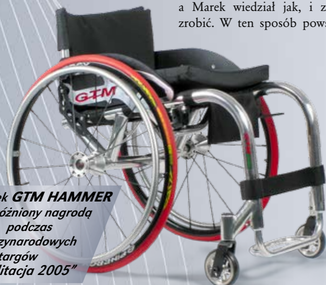
Wózek GTM HAMMER wyróżniony nagrodą podczas międzynarodowych targów „Rehabilitacja 2005”